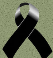
Juan Crisóstomo Osorio Azcuénaga (Abril 10 de 1870 – Mayo 1º de 1921).

“Un gran dolor me obligó entonces a volver a la patria, cuando empezaba a sentir el calor de la amistad bonaerense, que es hospitalaria y comprensiva. Ante el cable fatal, que en dos palabras me hablaba de orfandad, tuve que abandonar mi musa a una compañía de zarzuela española y volver solo al terruño a besar la frente de la madre viuda y a llorar un poco "sobre la mesa donde escribí las primeras comedias”.