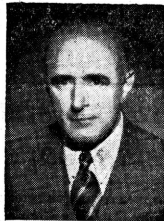
LUIS ENRIQUE OSORIO

La Compañía Bogotana de Comedias surgió hace nueve años, por iniciativa del señor Luis Enrique Osorio.